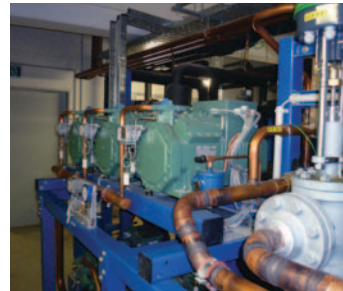
Abb. (v. l. n. r.): Betonkernaktivierung Heizungspuffer- und Kaltwasserspeicher Kälte-Wärme-Verbundanlage