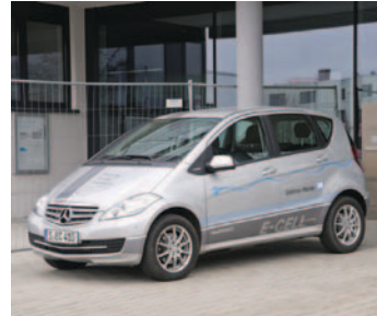
Abb. (v. l. n. r.): Freie Kühlung BHKW Einsatz von Elektrofahrzeugen