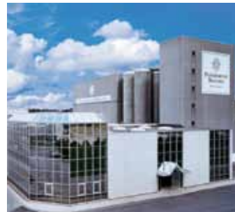
Von links nach rechts: Kompressorsteuerung im Maschinenraum der Paderborner Brauerei, Kompressor, Außenansicht der Paderborner Brauerei.